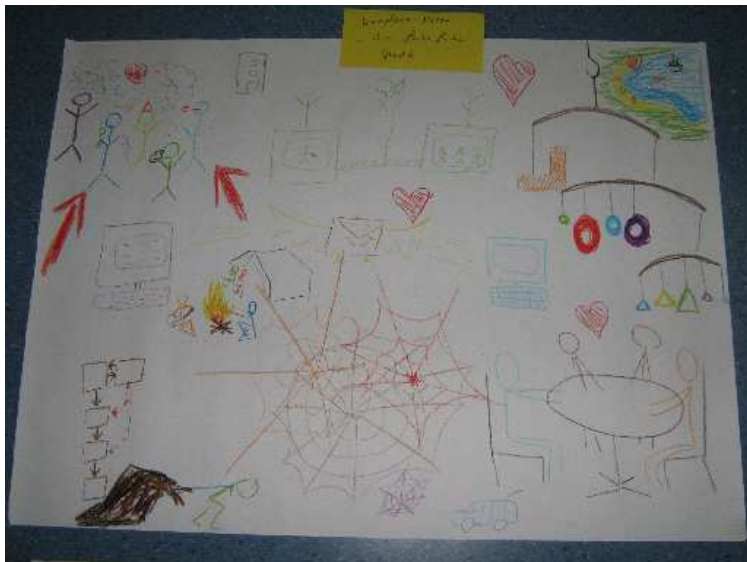
Komplexe Netze in ihrer farbenfrohen Pracht