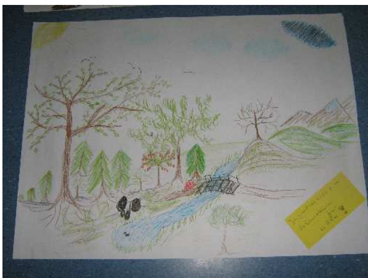
Jugendrotkreuz - Lebensraum für Alle!